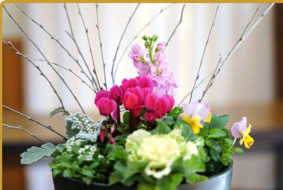
高尾いきいきサロン『お正月の寄植え』