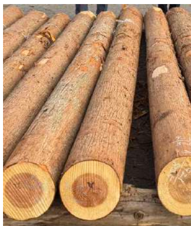
丁寧に手入れされた良質の受賞木（杉）

伊賀材の知名度向上に多大な貢献をされた功績に敬意を寄せるとともに地域の林業の大切さを改めて感じさせていただきました。